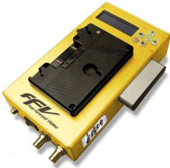
Zwischen Akku und Kamera kann der Diskrecorder Elite HD von FFV montiert werden.

im engeren Sinn. Diese Daten müssen vor der Vorführung in jedem Fall bearbeitet und aufbereitet werden, was eher den Abläufen bei der Filmproduktion entspricht, als der klassischen Videoproduktion. CF-Speicherkarten erreichen zudem nicht die für Redcode Raw festgelegten Datenraten, mit den Karten ist also keine Echtzeit-Wiedergabe möglich, sie dienen beim Einsatz mit Redcode Raw lediglich als Speichermedium, um Daten sichern und transportieren zu können, nicht als Wiedergabemedium. Die einfachere und vor allem die Echtzeit-Wiedergabe von Red-Aufnahmen soll eine Festplatte mit integriertem Hardware-Decoder erlauben.