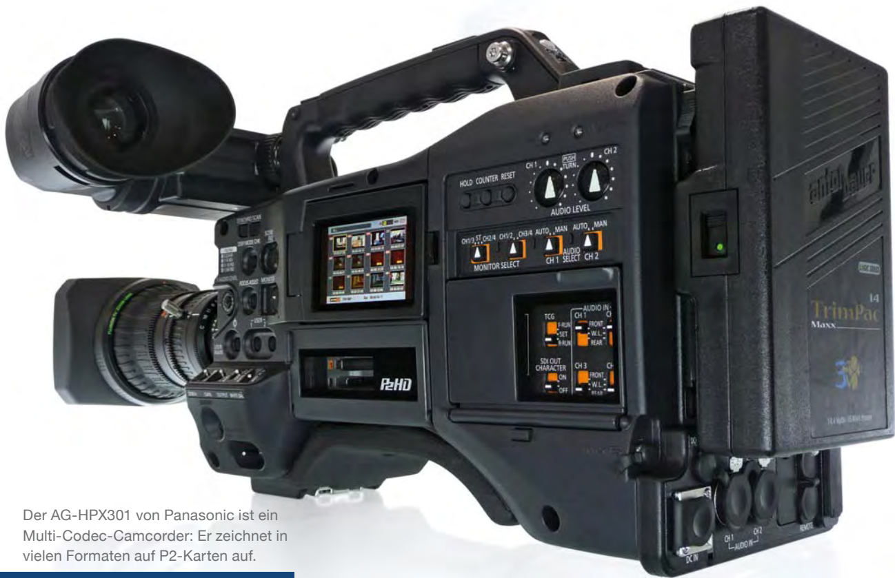
Der AG-HPX301 von Panasonic ist ein Multi-Codec-Camcorder: Er zeichnet in vielen Formaten auf P2-Karten auf.

ner Videodatenrate von 200 Mbps und einem Abtastverhältnis von 4:4:4 kann eine höhere Bildqualität aufzeichnen als eines mit 100 Mbps und 4:2:2, das wiederum mehr Qualität erlaubt als 4:2:0 mit 25 Mbps – aber es kommt eben auch auf den jeweils verwendeten Codec an. Eine wichtige Rolle spielt auch das Raster , mit dem das jeweilige Verfahren arbeitet. Bei SD-Verfahren liegt dieses Raster fest, bei HD gibt es zunächst den Unterschied zwischen 720 und 1080 Zeilen, aber innerhalb des 1080-Zeilen-Lagers gibt es eine weitere Unterteilung: Bei HDV und XDCAM HD wird mit dem reduzierten Raster von 1.440 x 1.080 Bildpunkten gearbeitet, statt mit dem vollen Raster von 1.920 x 1.080, das etwa bei XDCAM HD 422 und HDCAM zum Einsatz kommt. Weiteren Einfluss hat das Kompressionsverfahren . Die zur Datenreduzierung eingesetzten Codecs produzieren unterschiedlich gute Ergebnisse. Ziel ist es immer, die verfügbare Datenrate optimal zu nutzen und dabei eine möglichst hohe Bildqualität zu erreichen. Ein grundlegender Unterschied besteht darin, ob nur innerhalb eines Bildes