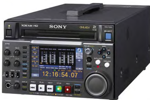
Sony bietet für die Professional Disc kompakte Decks an.