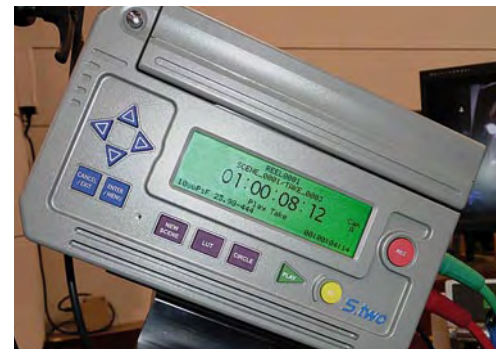
Der kompakte OB 1 von S Two lässt sich wie ein Filmmagazin auf Digitalkameras montieren.

SD-Card: SD ist das Kürzel für das von SanDisk entwickelte, kompakte Speicherchip-System Secure Digital. SD-Karten sind kleiner und dünner als CF-Speicherkarten. Die aktuell leistungsfähigste Version von SD-Speicherkarten sind SDHC-Karten. Schon angekündigt, aber noch nicht verfügbar: SDXC