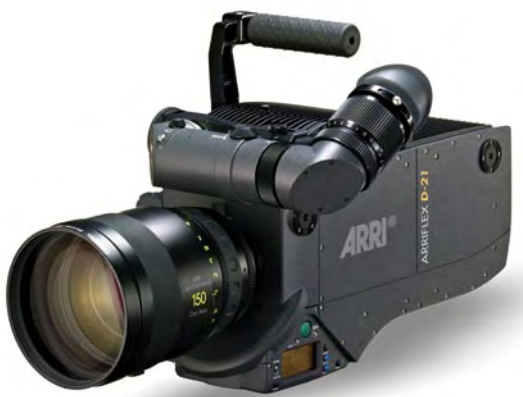
Arri hat mit der D21 eine digitale Kamera im Programm, die HD-Signale und Raw-Daten ausgeben kann.

Camcorder im XDCAM-Format an. Diese Geräte können ausschließlich Single-Layer-Discs verarbeiten. Der Begriff XDCAM mit den Zusätzen HD, EX oder HD 422 beschreibt andere, HD-fähige Formate (siehe dort). Aber auch die HD-Geräte aus der XDCAM-Familie können im SD-Modus arbeiten. Dabei werden DVCAM-Files auf die Disc geschrieben. Auf die Dual-Layer-Disc, mit der diese Geräte arbeiten können, passen über drei Stunden DVCAM-Material.