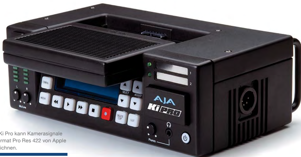
Ajas Ki Pro kann Kamerasignale im Format Pro Res 422 von Apple aufzeichnen.

nehmen. Hierbei verwendet der Hersteller das eigene Kompressionsverfahren Redcode Raw. Dabei werden die Rohdaten des Bildsensors unter Einsatz eines Wavelet-Verfahrens mit variabler Bitrate komprimiert (ähnlich JPEG2000). Die maximale Datenrate kann dabei auf 224 Mbps oder auf 288 Mbps festgelegt werden, was einer Kompression von 12:1 und 9:1 entspricht, wenn man die Rohdatenrate zugrunde legt, die der Sensor abgibt. Aufgezeichnet werden dabei komprimierte Rohdaten, also keine RGB- oder Videosignale