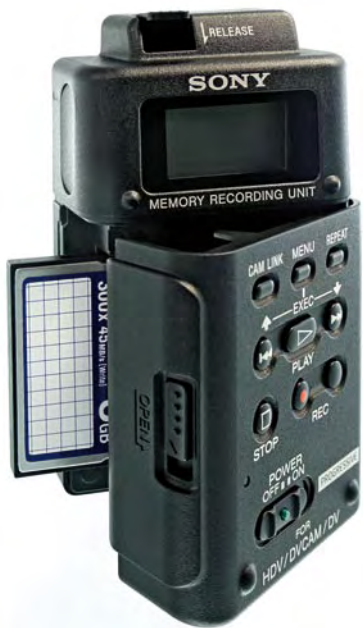
Mit einigen HDV-Camcordern liefert Sony den CF-Recorder MRC-1 aus.

im engeren Sinn. Diese Daten müssen vor der Vorführung in jedem Fall bearbeitet und aufbereitet werden, was eher den Abläufen bei der Filmproduktion entspricht, als der klassischen Videoproduktion. CF-Speicherkarten erreichen zudem nicht die für Redcode Raw festgelegten Datenraten, mit den Karten ist also keine Echtzeit-Wiedergabe möglich, sie dienen beim Einsatz mit Redcode Raw lediglich als Speichermedium, um Daten sichern und transportieren zu können, nicht als Wiedergabemedium. Die einfachere und vor allem die Echtzeit-Wiedergabe von Red-Aufnahmen soll eine Festplatte mit integriertem Hardware-Decoder erlauben.