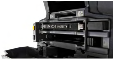
SD-Karten-Slots bei P2-Geräten dienen nur zum Speichern von Kamera-Settings.