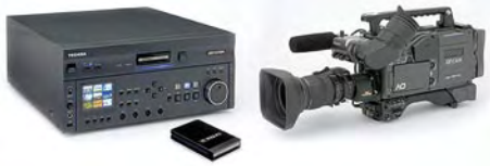
Ikegami und Toshiba haben gemeinsam das GF-System entwickelt.