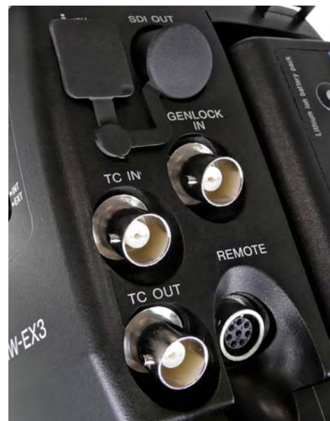
Sonys EX3 eignet sich dank Genlock- und TC-I/Os auch für Multikamera-Produktionen.

Redcode Raw: Die Red One wird derzeit besonders von Independent-Filmern stark beachtet: Sie verspricht kinotaugliche Bilder mit 4K-Auflösung zu vergleichsweise moderaten Preisen. Die Red One kann auf CF-Speicherkarten oder auf Festplatte auf-