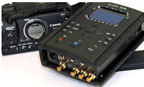
Covergents XDR ist ein externer CF-Recorder, der via HD-SDI mit Camcordern verbunden werden kann.